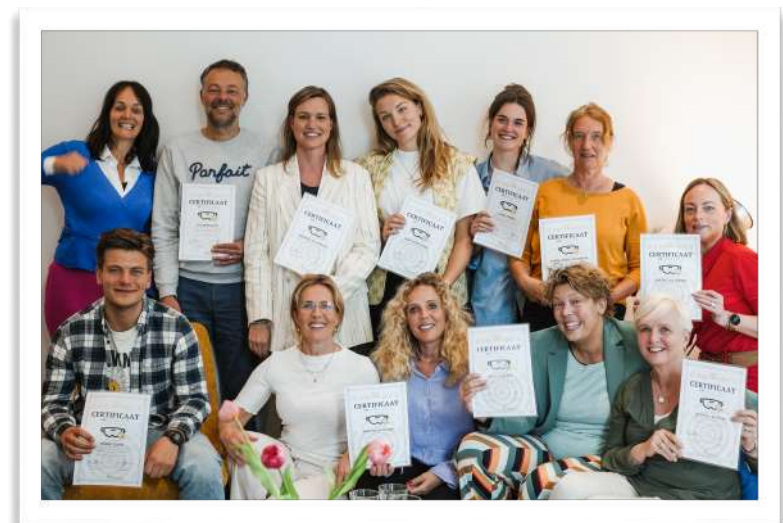
Opleiding tot VRandercoach - groep 2

Na de basis-training blijven de coaches deel uitmaken van de community en zo aangehaakt op nieuwe ontwikkelingen en zijn er vervoltrainingen mogelijk voor nieuwe aanvullingen op de methode.